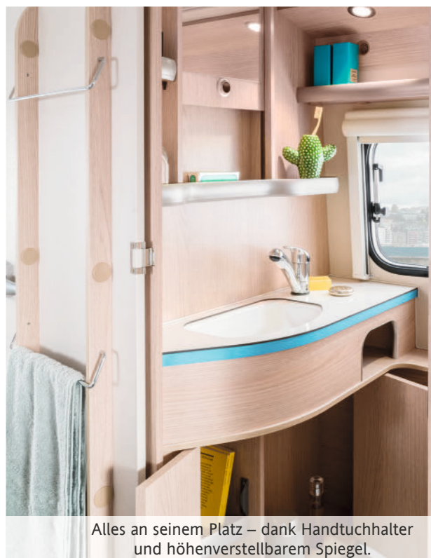
Alles an seinem Platz – dank Handtuchhalter und höhenverstellbarem Spiegel.

Was die äußere Form und Farbgebung bereits weithin sichtbar ankündigt, findet im Innern des ERIBA Troll 530 Ocean Drive konsequent seine Fortsetzung: Retro-Charme in Vollendung. In Sachen Ausstrahlung präsentiert sich der ERIBA Caravan hingegen sehr modern. Analog zum Rockabilly erfüllt das exklusive Interieur im Schlafbereich sowie in Küche und Bad höchste Ansprüche in puncto Komfort und Funktionalität. Willkommen in Ihrem ganz persönlichen Diner!