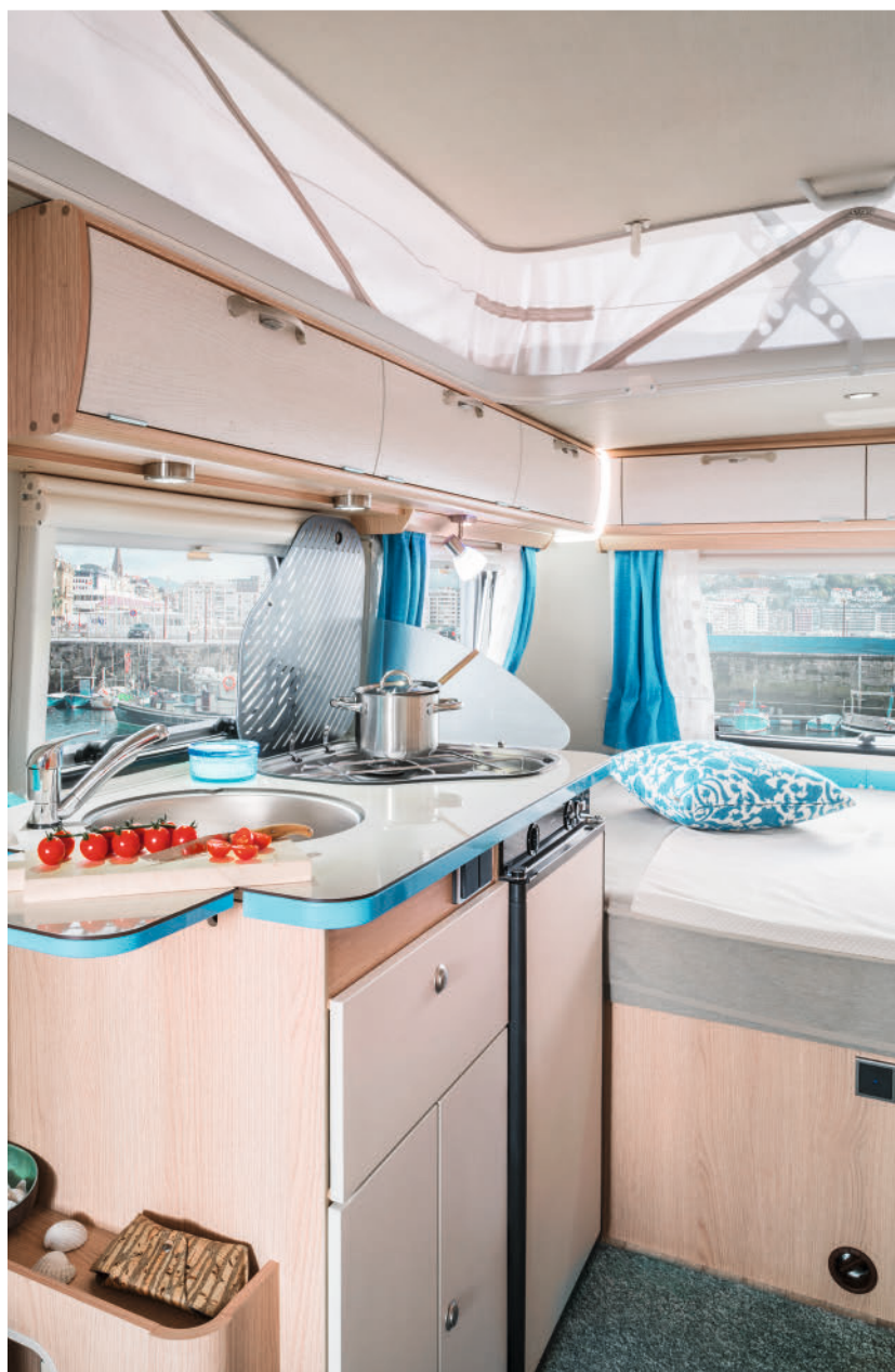
Arbeitsplattenverlängerung und optionale Spülenabdeckung machen hier jede Stunde zur Happy Hour.