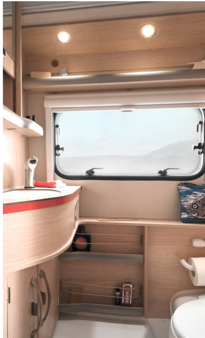
Exklusives Raumbad mit ausstellbarem Badfenster.

Reisen Sie zurück in die Zukunft! Im Retro-Chic mit intelligenten und technisch ausgefeilten Details, die keine Wünsche offen lassen! Die Küche verbreitet mit ihrem lebendigen Farbkonzept sofort einladenden American-Diner-Charme. Genießen Sie auf Komfortpolstern mit hohem Rücken diesen ganz besonderen Life-Style. Dazu macht das exklusive Interieur in Schlafbereich und Bad jede Tour unvergesslich.