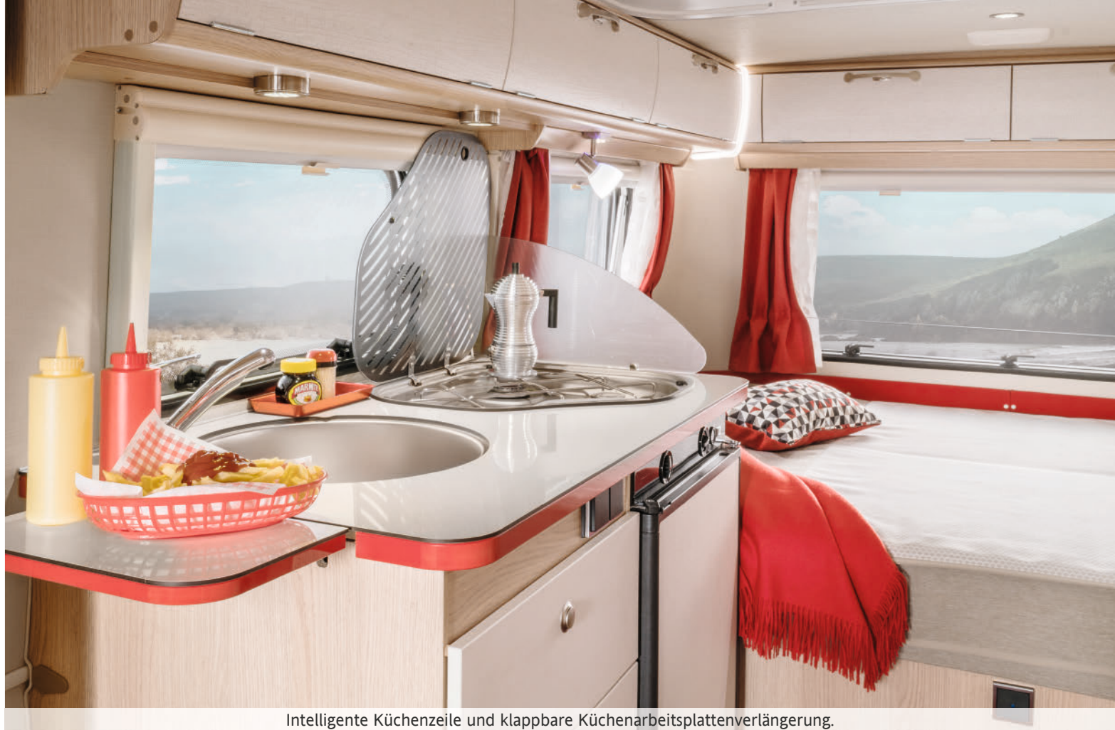
Intelligente Küchenzeile und klappbare Küchenarbeitsplattenverlängerung.

Reisen Sie zurück in die Zukunft! Im Retro-Chic mit intelligenten und technisch ausgefeilten Details, die keine Wünsche offen lassen! Die Küche verbreitet mit ihrem lebendigen Farbkonzept sofort einladenden American-Diner-Charme. Genießen Sie auf Komfortpolstern mit hohem Rücken diesen ganz besonderen Life-Style. Dazu macht das exklusive Interieur in Schlafbereich und Bad jede Tour unvergesslich.