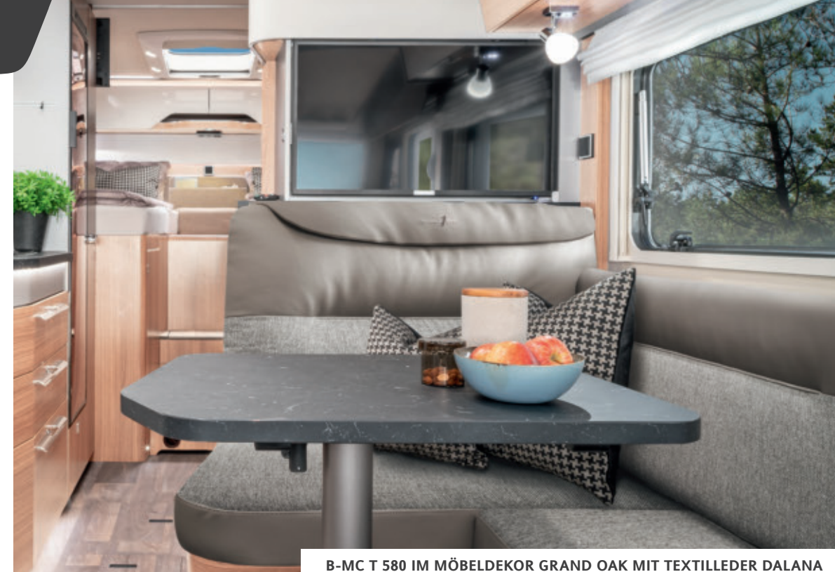
B-MC T 580 IM MÖBELDEKOR GRAND OAK MIT TEXTILLEDER DALANA