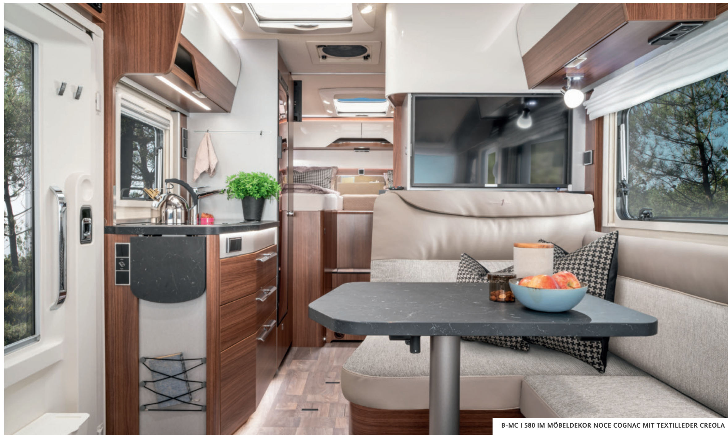
B-MC I 580 IM MÖBELDEKOR NOCE COGNAC MIT TEXTILLEDER CREOLA