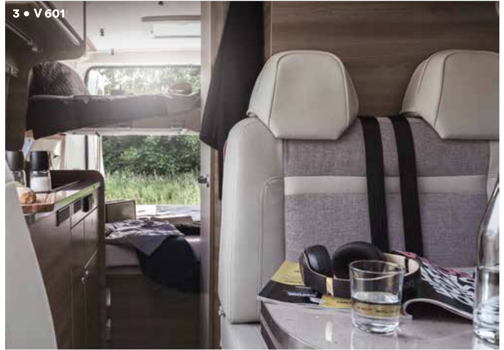
3 • V 601