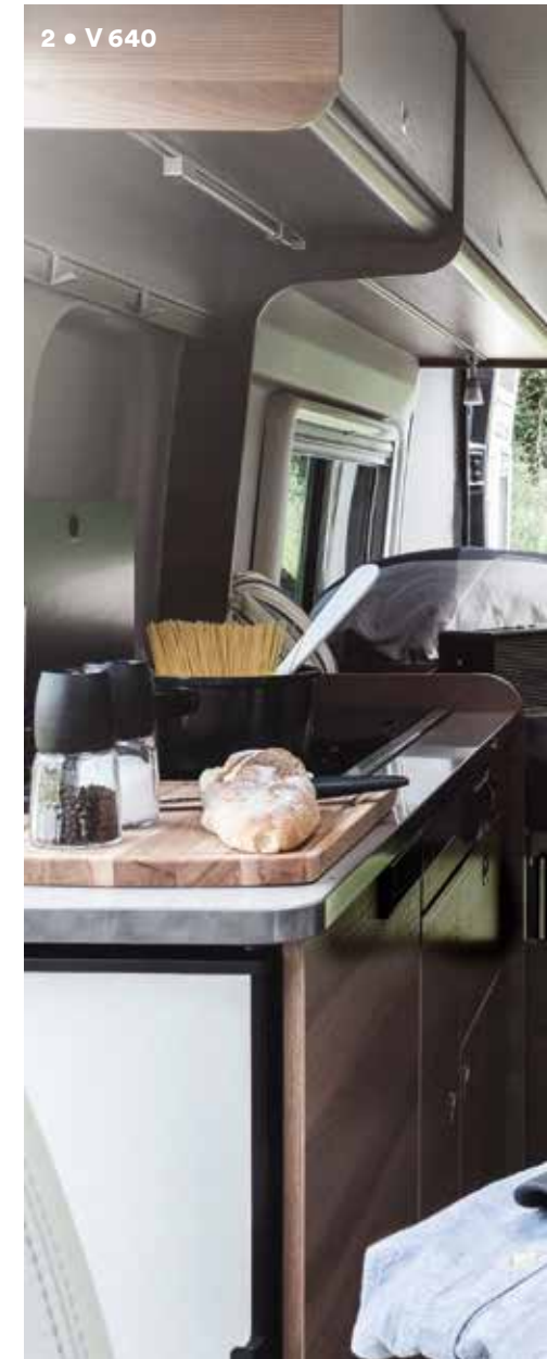
2 • V 640