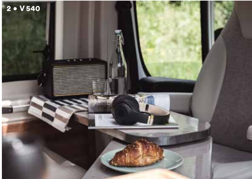
2 • V 540