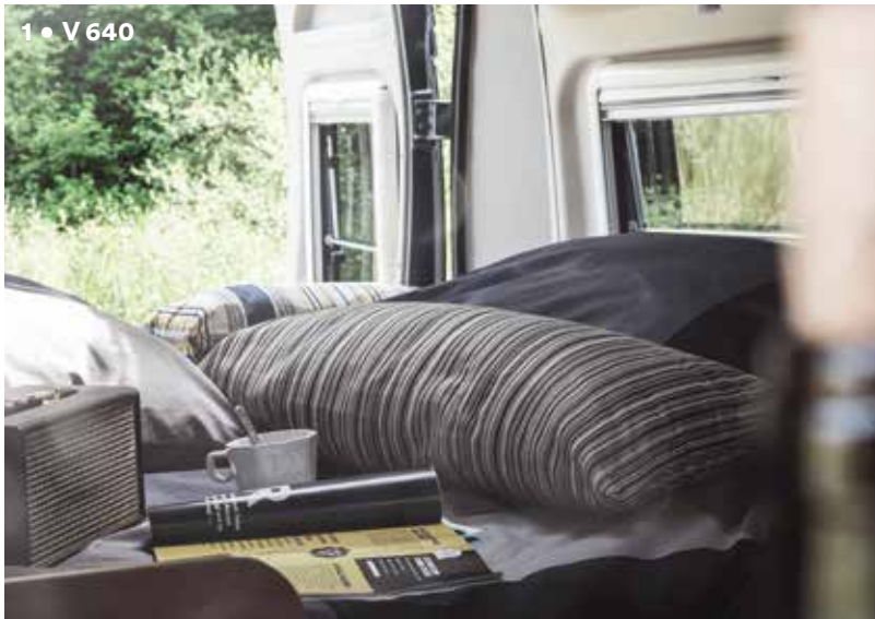
1 • V 640