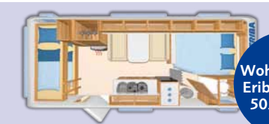
Wohnwagen: Eriba Exiting 505 family

Preisklasse 2 (PK2): Hochsaison 30.06. - 11.08. Preis pro Nacht . . . . . 90,- € Preis pro Woche . . . . . 595,- €