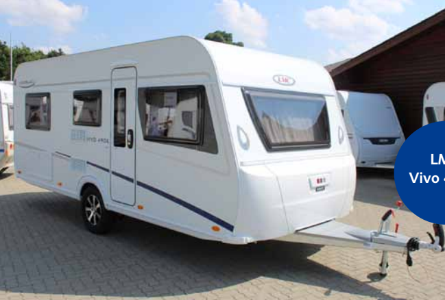
LMC Vivo 490 E