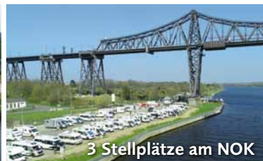
3 Stellplätze am NOK