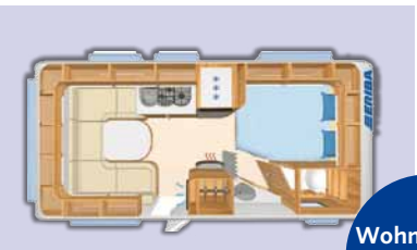
Wohnwagen: Eriba Exiting 485