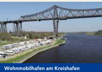
Wohnmobilhafen am Kreishafen

Alle guten Dinge sind 3: Im Jahr 2020 haben wir den Wohnmobilhafen am Flugplatz Schachtholm NOK übernommen. Hier gibt es im Grünen 52 Wohnmobilstellplätze direkt am Nord-Ostsee-Kanal- nur eine Straße trennt den NOK von den Reisemobilisten. Direkt nebenan befindet sich der Flugplatz Schachtholm sowie eine nette Gastwirtschaft namens Himmlsstürmer. Ver- und Entsorgung sowie Stromsäulen vorhanden.