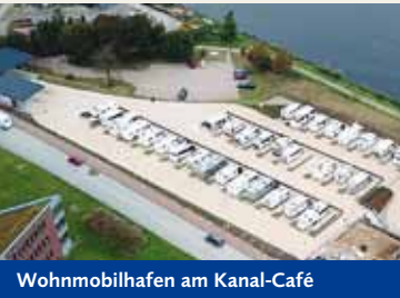
Wohnmobilhafen am Kanal-Café

Schräg gegenüber zum Rendsburger Kreishafen wurde im September 2017 der Wohnmobilhafen am Kanal-Café in Osterrönfeld eröffnet. Ganzjährig bietet dieser moderne Platz 33 Stellplätze über drei Ebenen überall einen 1ste-Reihe-Blick auf den regen Schiffsverkehr. Direkt nebenan befindet sich die Kanalmeisterei, ehemals Kanal-Café, das seinen Gästen 7 Tage die Woche ganzjährig vom Brötchenservice und Frühstück bis zum Abendessen verwöhnt. Ebenso nebenan befindet sich das Kanal-Haus, welches mit 15 Gästezimmern ebenfalls für Fahrradtouristen, Geschäftsleute, Urlauber oder einfach Freunde der Wohnmobilsten ohne Fahrzeug schöne Übernachtungsmöglichkeiten anbietet.