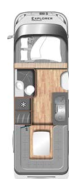
I 650 G