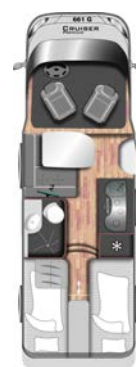
T 661 G