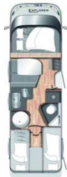
I 730 G