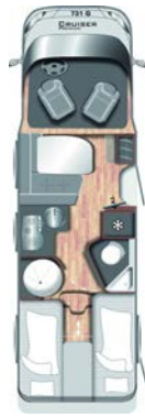
T 731 G